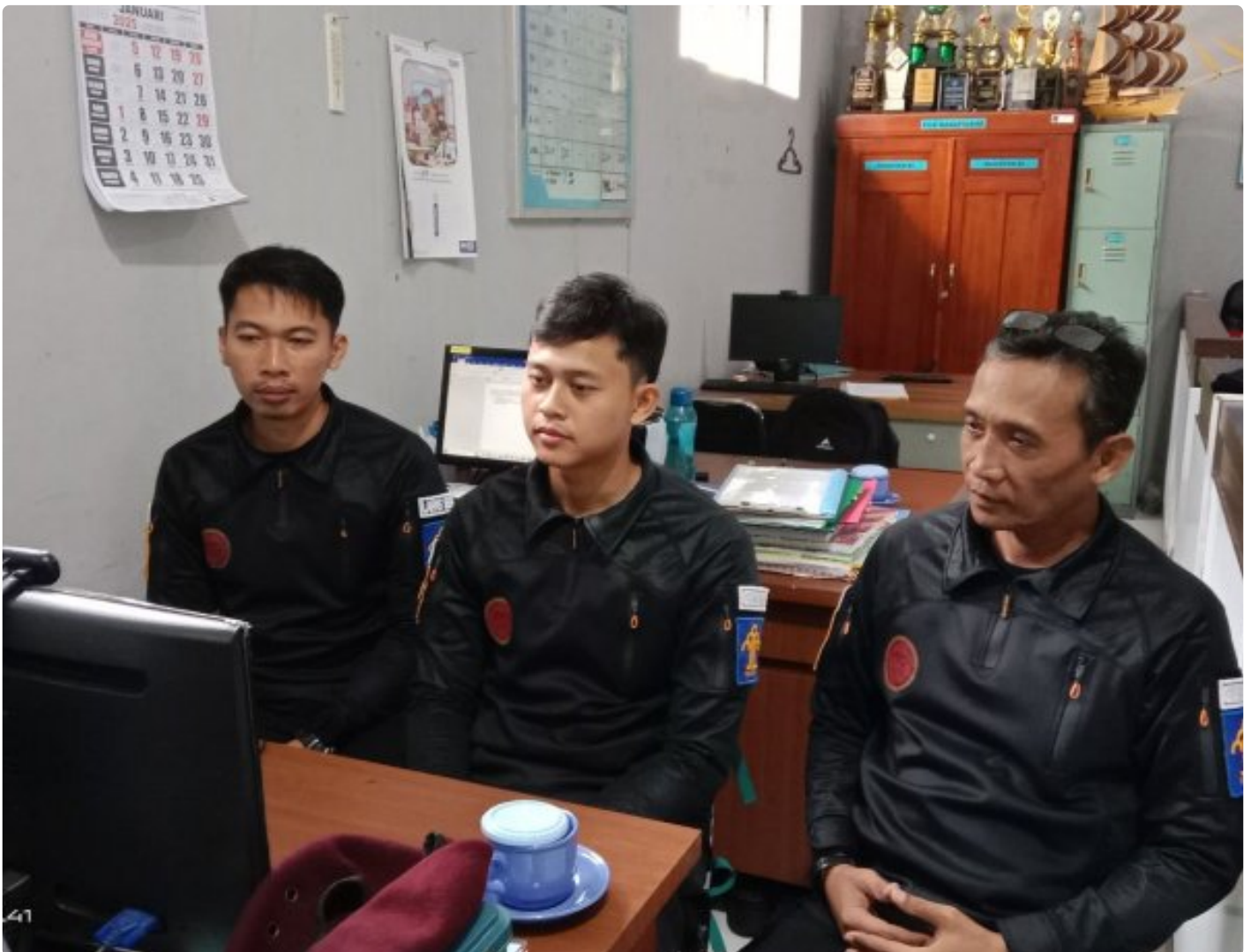
Bangun Harmoni dan Strategi, Lapas Besi Ikuti Webinar Refleksi Akhir Tahun 2024 & Resolusi 2025

CILACAP – Sebagai salah satu langkah dalam pengembangan kompetensi bagi